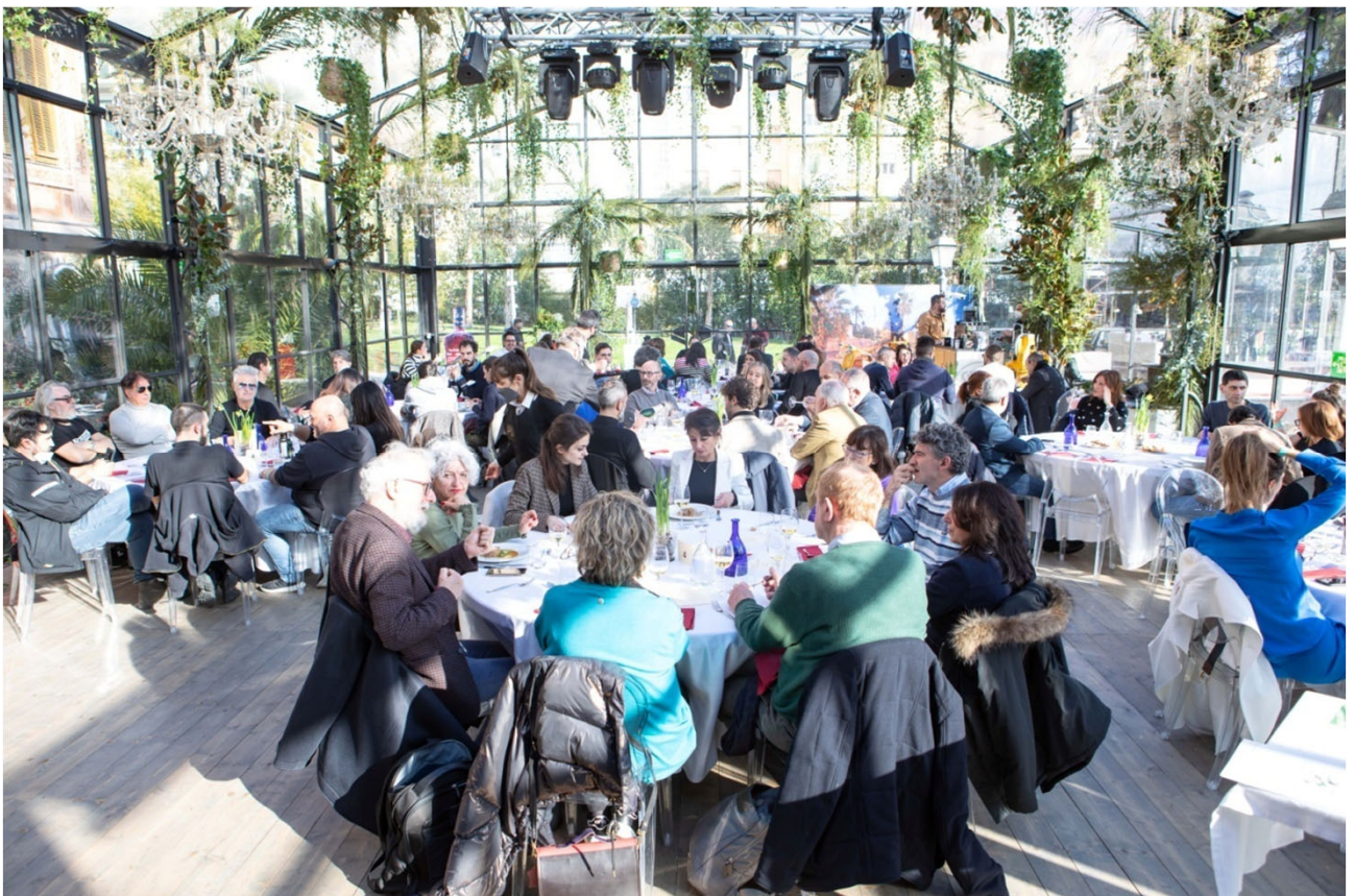
convegno del 2022